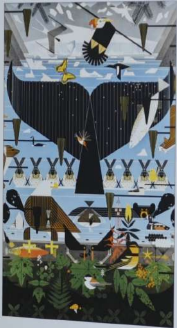
Glacier Bay, Alaska